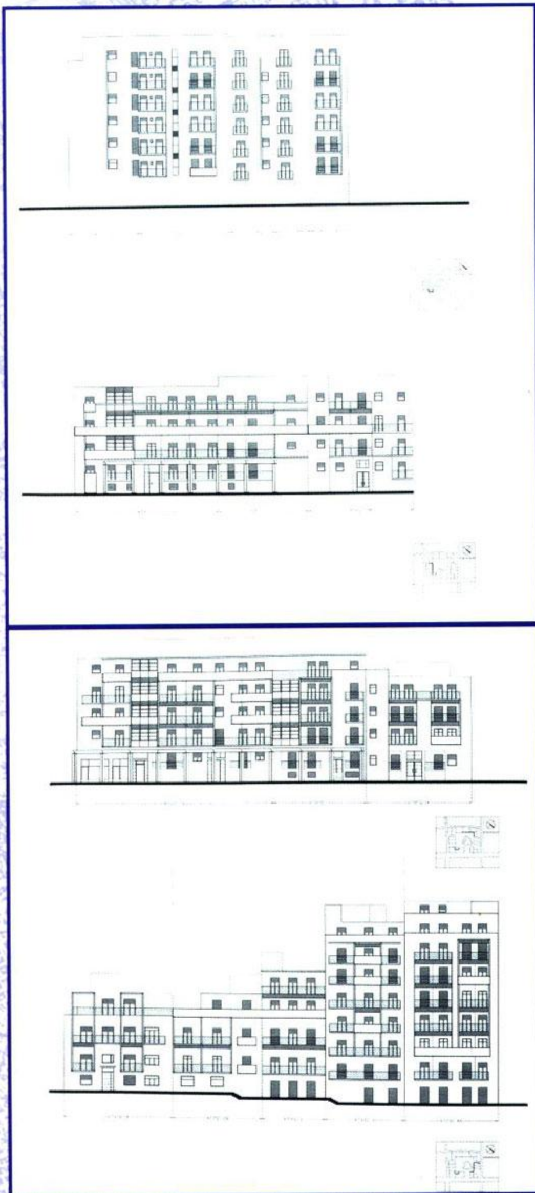
ΟΨΕΙΣ ΣΤΟ ΕΣΩΤΕΡΙΚΟ ΤΗΣ ΠΛΑΤΕΙΑΣ